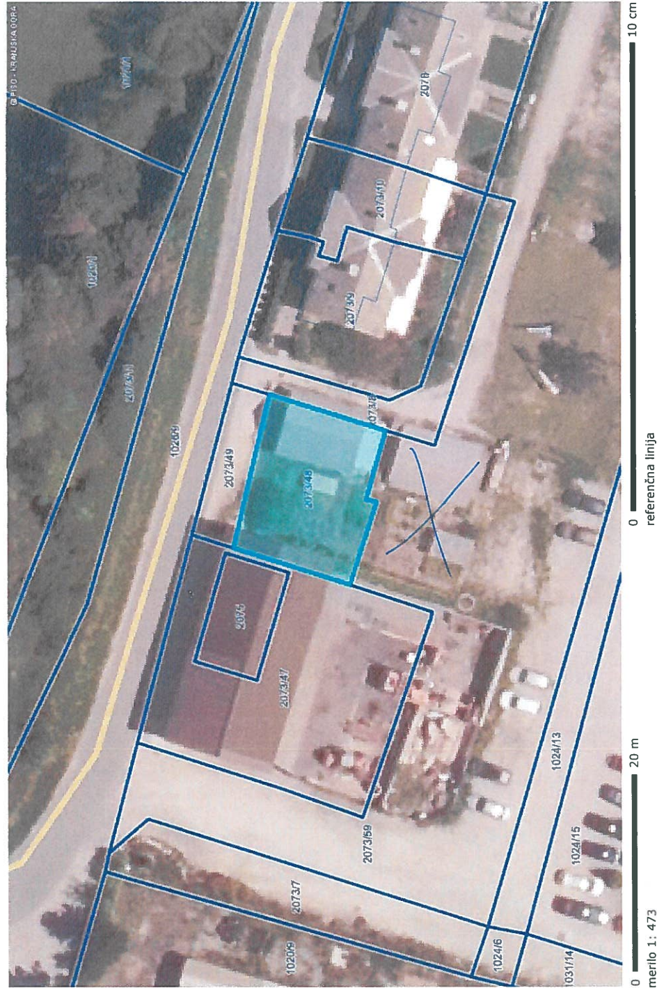
OZNAČENA PARCELA: katastrska občina: 2171-DOVJE, parcela: 2073/48

http://www.geoprosor.net/piso ; čas izpisa: 28. avgust 2019 11:45:54; uporabnik: kosir@kranjska-gora.si Numerično merilo je veljavno, če znaša dolžina referenčne linije 10 cm. Grafično merilo je veljavno v vsakem primeru.